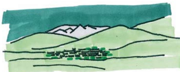
RASSEMBLER - construire modeste