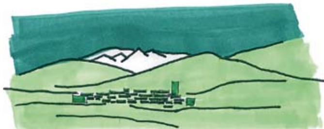
DISPERSER - construire haut et grand

Les communes qui se ressemblent peuvent se regrouper pour avoir des documents d'urbanisme ou des réflexions d'aménagement communs. Par exemple : les villages qui se voient d'un côté à l'autre de la Cerdagne comme Font-Romeu avec Eyne et Saint Pierre dels Forcats les villages situés en fond de vallée comme Saillagouse, Osseja ou Angoustrine