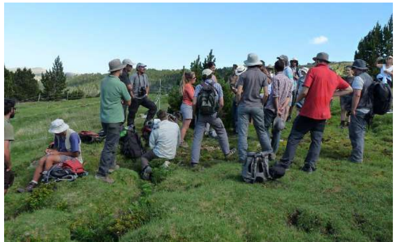
Foto 1 : les primeres trobades de la xarxa FloraCat van tenir lloc al 2012.

Creixent amb el pas del temps, aquesta xarxa és la clau de volta de l'associació transfrontera desitjada i dirigida per la Federació de Reserves Naturals de Catalunya. Aquesta col·laboració, recentment, ha permès estructurar el projecte Floralab.