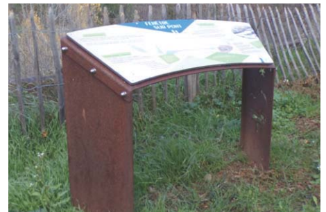
Modèle 6 en acier corten