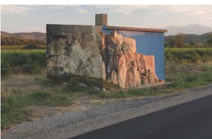
Exemples de trompe-l'oeil en lien avec le paysage et la vie locale intéressants