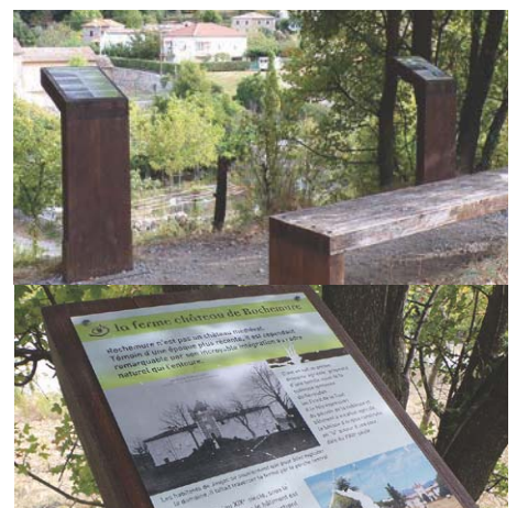
Modèle 5 : simples pupitres en bois local avec plaque en dibond