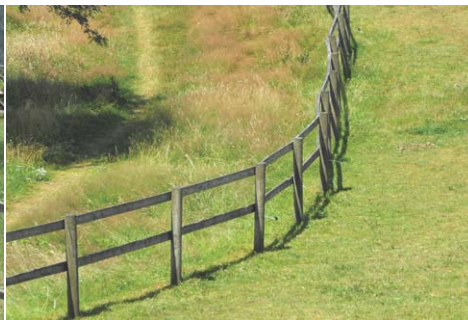
Modèle 1 : 2 lisses bois local, protection des poteaux verticaux