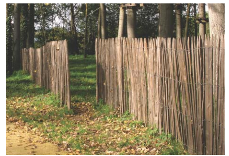
Modèle 2 : ganivelles en châtaignier