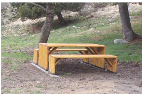
Modèle 3 : Tables-bancs en pin local, fabrication sur mesure