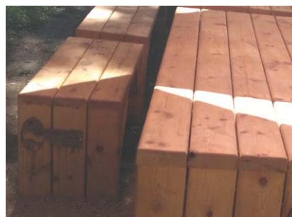
Modèle 4 : Banc en bois local, sans dossier, fabrication sur mesure