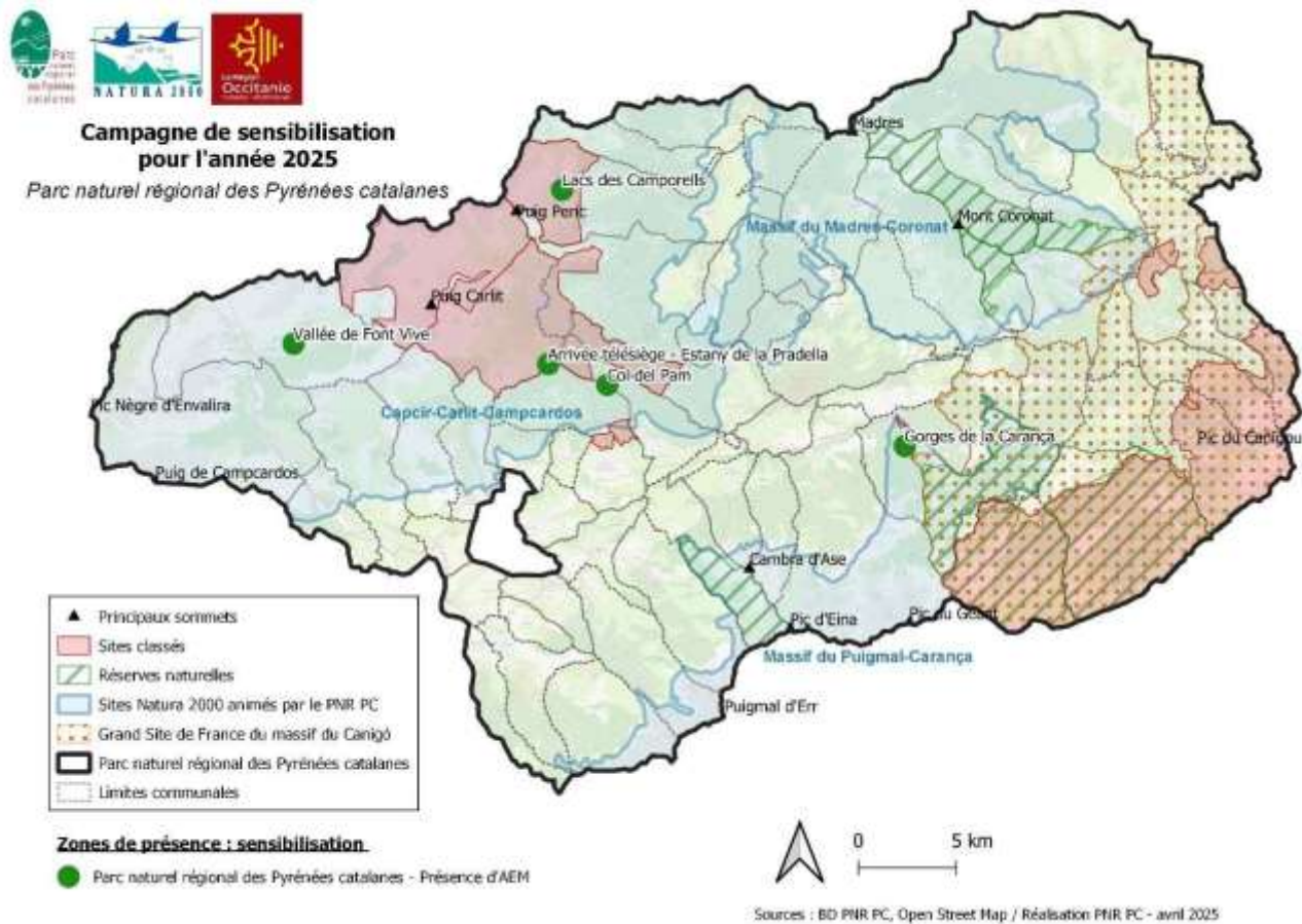
Figure 2 : Localisation des secteurs identifiés pour la mise en place d'une sensibilisation in-situ du grand public